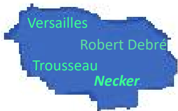
Île de France